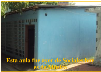
Esta aula fue ayer de Sociales hoy es de Música