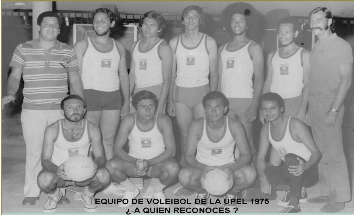
EQUIPO DE VOLEIBOL DE LA UPEL 1975 ¿ A QUIEN RECONOCES ?